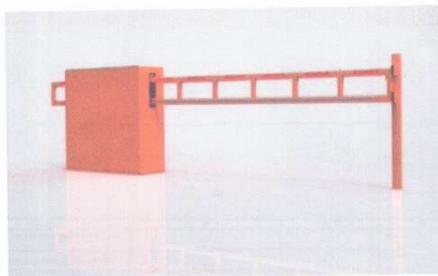
Рис. 2 Внешний вид предполагаемого к размещению объекта